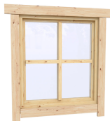
0.87×0.78 м.2 шт.