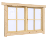
1.34×0.91 м.3 шт.